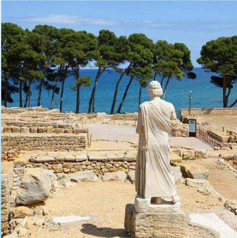
Ruinas de Empuries

¿Qué atracciones turísticas hay? (por ejemplo: monumentos, museos, plazas, playas, iglesias o parques importantes)