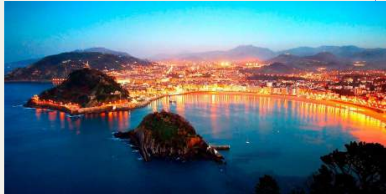
(La playa de La Concha)

+ Dos playas muy populares son la playa de La Concha y la playa de la Zurriola.