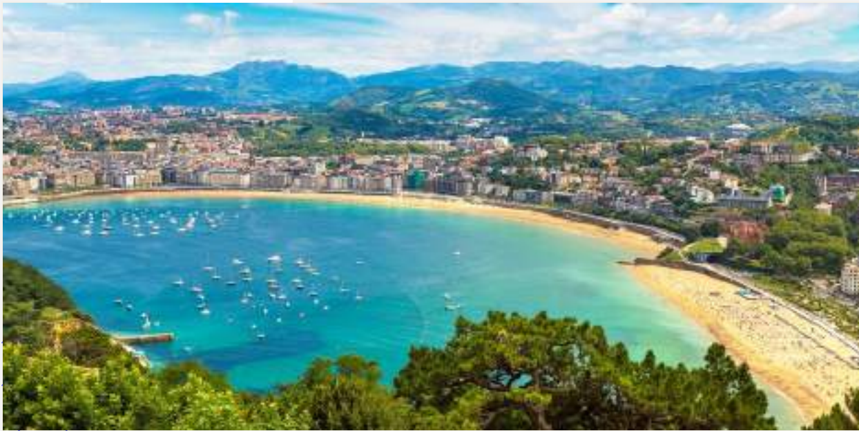
(La playa de la Zurriola).

+ Dos playas muy populares son la playa de La Concha y la playa de la Zurriola.