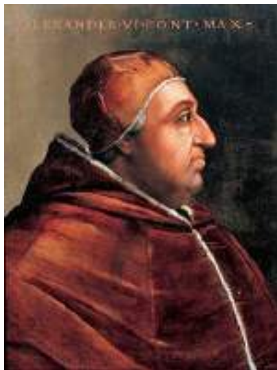
Papa Alexander VI

¿Sabías que el Papa Alexander VI, Papa Callixtus III, Camilo Sesto eran Valencianos?