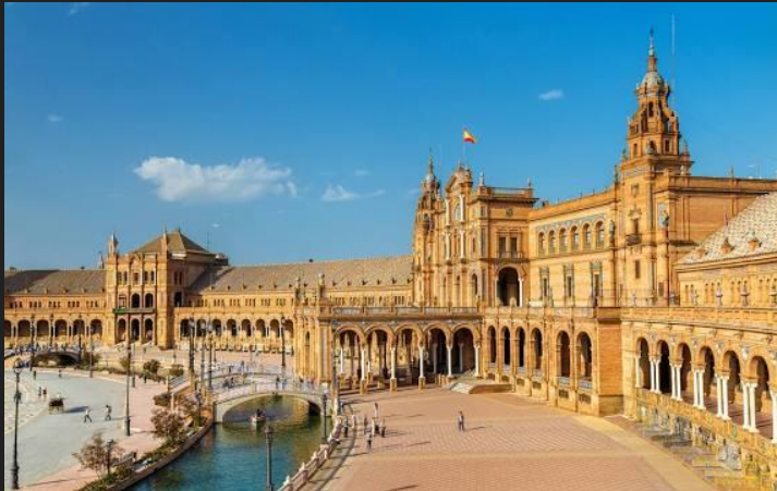
La Plaza de España