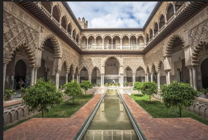
El Real Alcázar de Sevilla