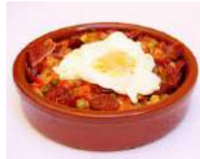
Huevos a la flamenca