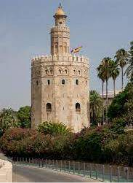
La Torre de Oro