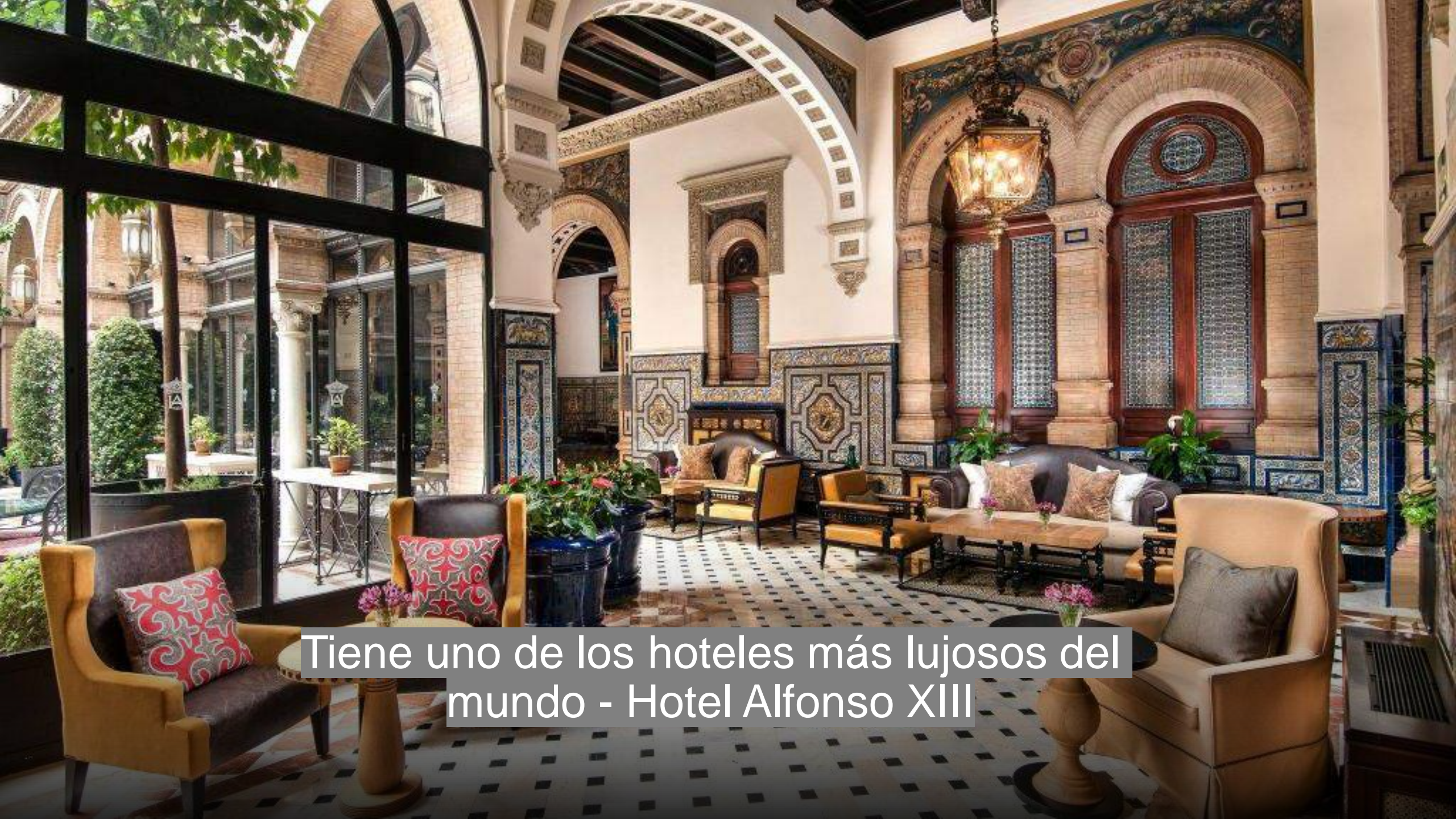
Tiene uno de los hoteles más lujosos del mundo - Hotel Alfonso XIII