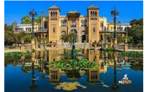
Parque de María Luisa