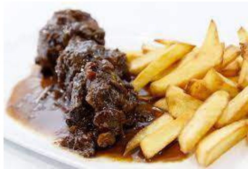
Rabo de toro