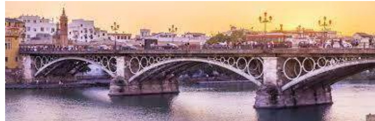
Puente de Triana