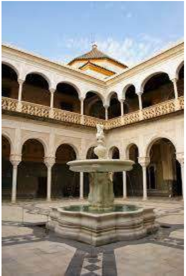
La Casa de Pilatos