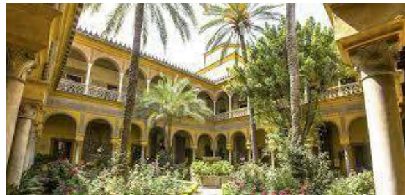
El Palacio de las Dueñas