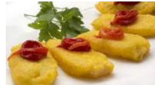
Soldaditos de Pavía