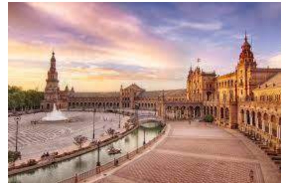
La Plaza de España