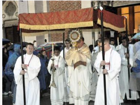
Día del Corpus.