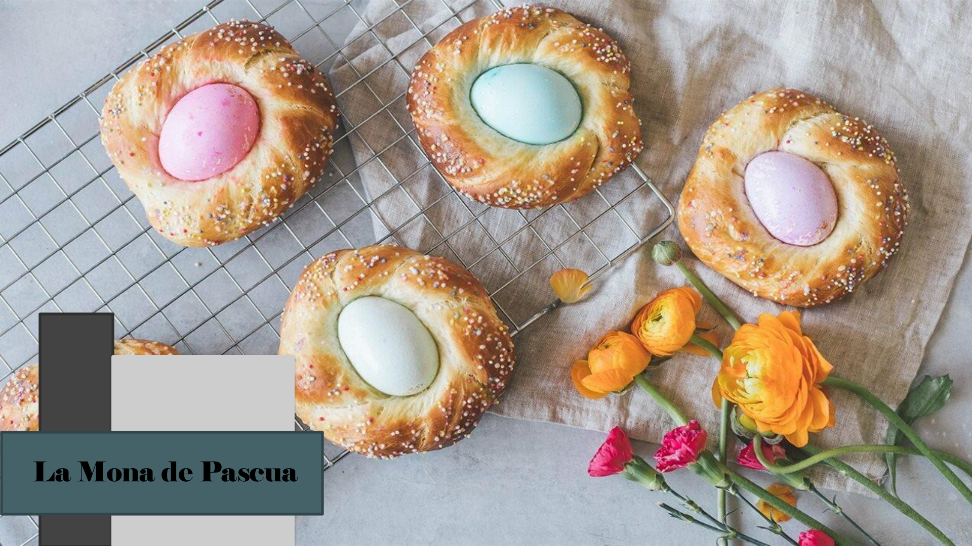
La Mona de Pascua