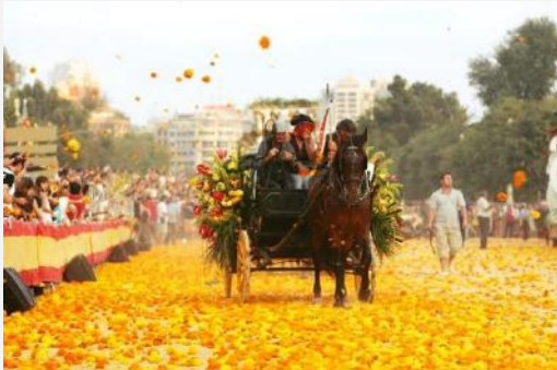
Feria de Julio.