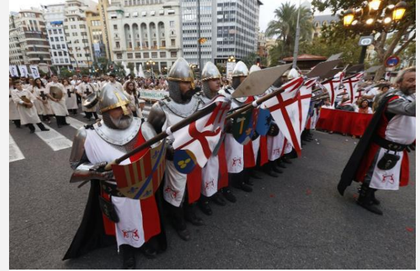
9 de Octubre.